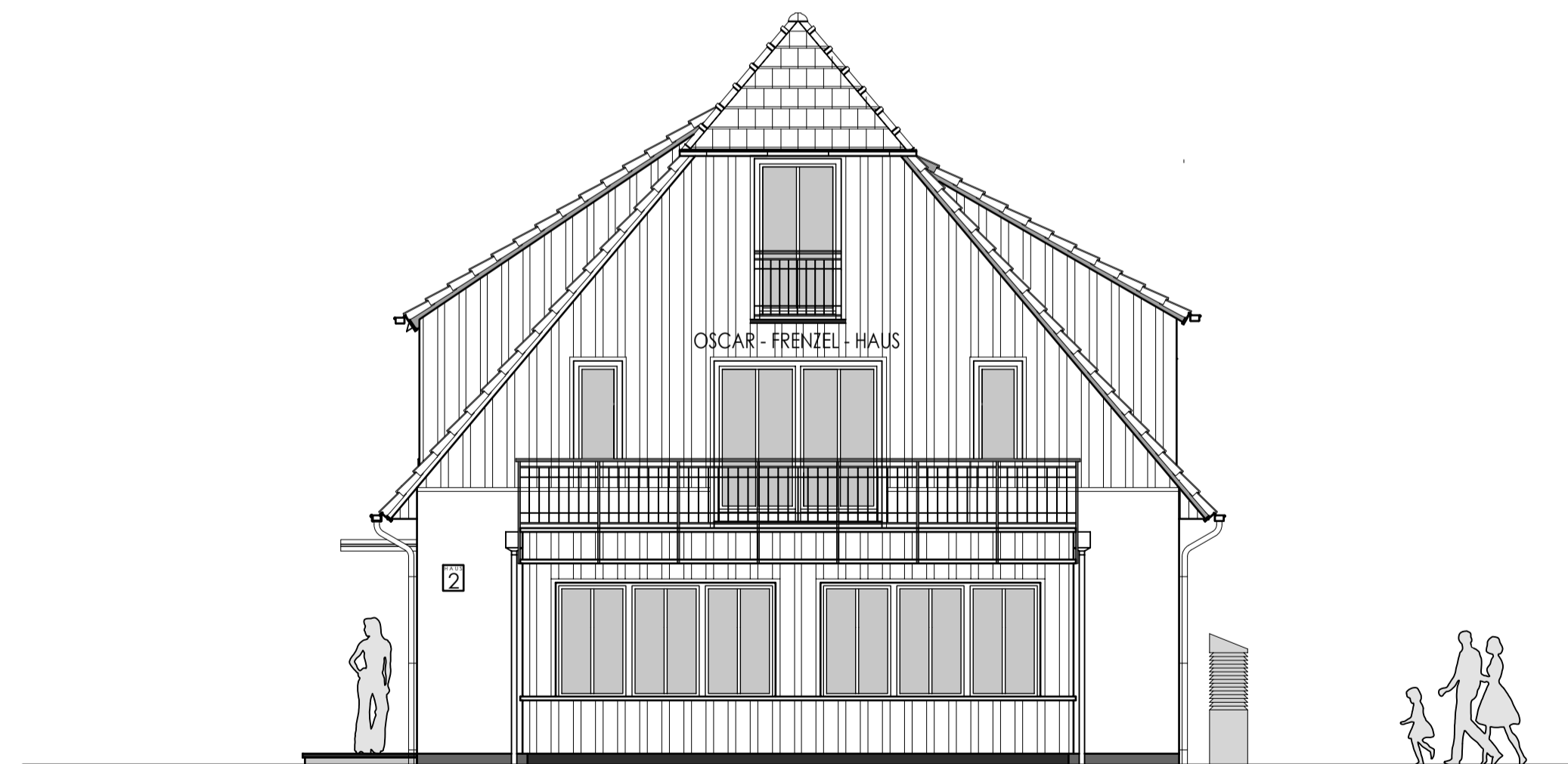
Nord- Ost- Ansicht