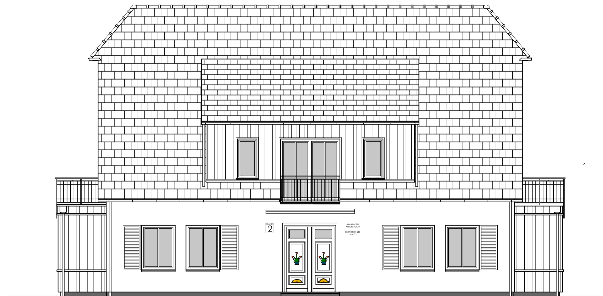
Süd- Ost- Ansicht