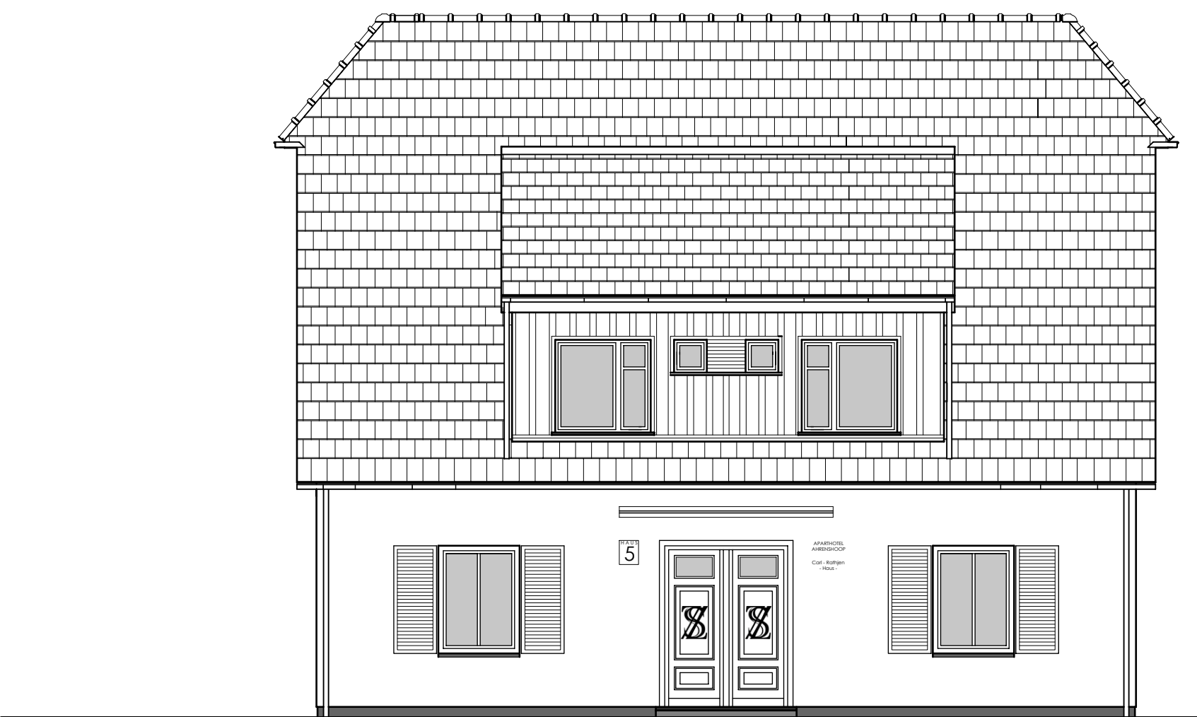
Süd- Ost- Ansicht